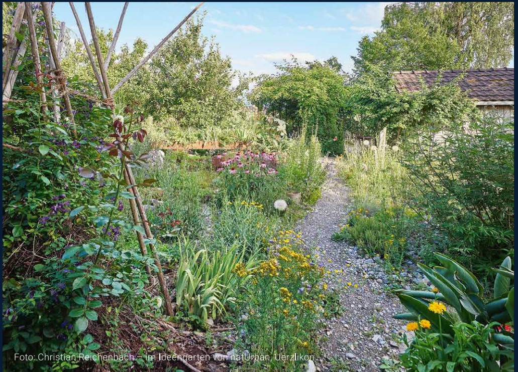
Im Ideengarten von na:Urban, Uerzlikon