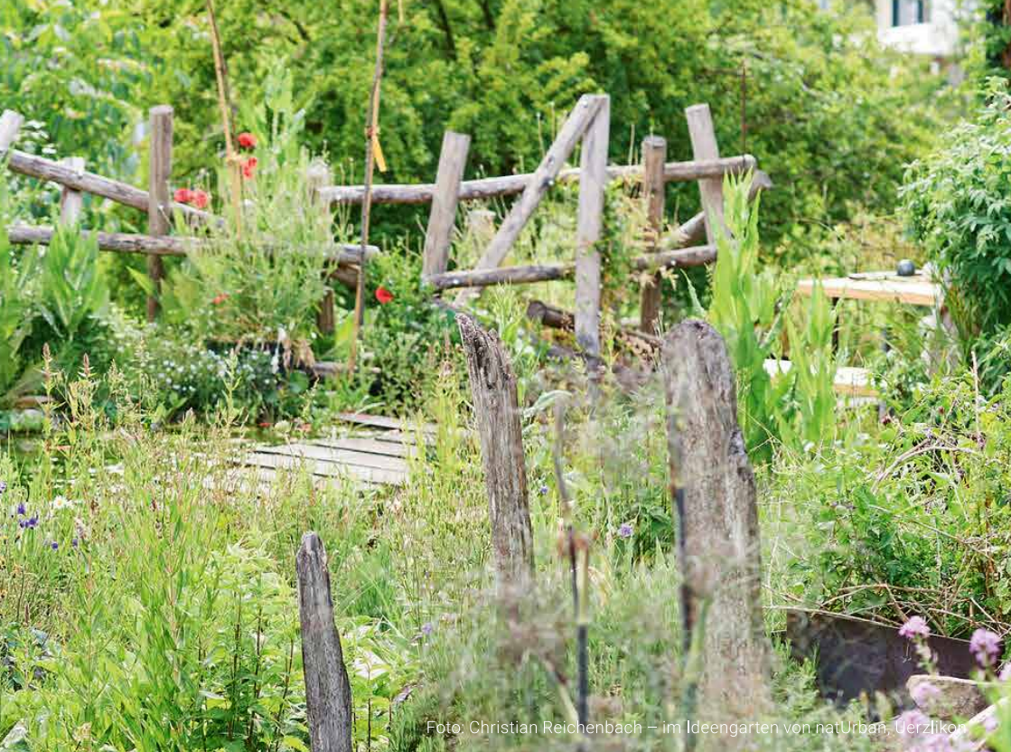
im Ideengarten von natUrban, Uerzikon